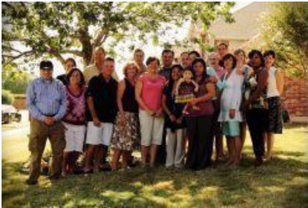
Retrato familiar: una hermana graduada en Dallas, TX y su Mesa.

Cada Mesa es organizada por una congregación (hasta tres congregaciones pueden compartir una Mesa). Un equipo requerido de voluntarios (de 10 a 12 personas ayudan al adulto o la familia y de 6 a 7 ayudan a un joven adulto que hace la transición de un hogar de acogida o a un veterano) prestan servicios por un período de 8 a 12 meses. Las Mesas habitualmente se reúnen una vez por semana y, a veces, menos frecuentemente a medida que el trabajo avanza. Los miembros de la mesa son principalmente generalistas, trabajan como equipos y también ofrecen liderazgo para dominios vitales importantes (consulte el diagrama del modelo de Open Table). Un equipo nacional de capacitadores voluntarios de Open Table capacita al coordinador voluntario de la congregación en cada comunidad de fe para liderar el modelo y presentar las Mesas.